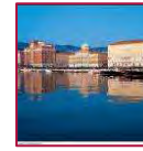
Friuli Venezia Giulia